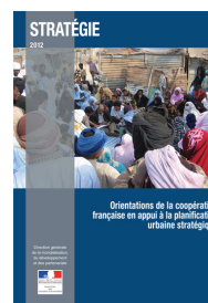
Les Orientations de la coopération française en appui à la planification urbaine stratégique 2012 est disponible en ligne.

Les partenaires internationaux ont salué le caractère novateur du PFVT.