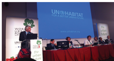
Hubert Julien-Laferrrière, vice-président du Grand Lyon, lors de la session spéciale d'ONU-Habitat sur la décentralisation et l'accès aux services de base.

multi-acteurs qu'il a permis de faire émerger, dans la lignée des « Orientations de la coopération française en appui à la gouvernance urbaine démocratique » publiées en 2009.